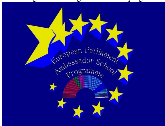
3. sz. ábra: az EPAS program logója Figure 3. The logo of the EPAS program