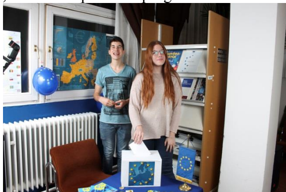
1. sz. kép: A „Gyere, lefényképezünk!” program az új EU Infoponton Picture 1. „Come on, let's take a picture!” program in the new EU Information Corner