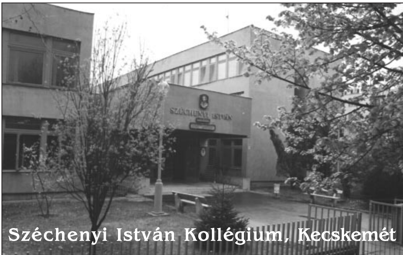
Széchenyi István Kollégium, Kecskemét