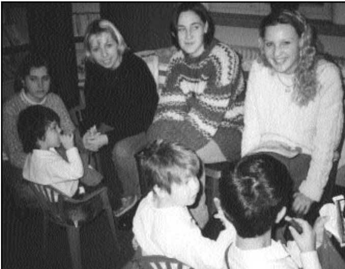
Az ógyallai gyermekotthonban

A diáktanács segítségével sok sportakciót, érdekes beszélgetéseket, kiállítást szervezünk. Jól együtt működünk régióink más kollégiumaival. A dunaszerdahelyi, megyeri, gadóci, komáromi diákotthonokkal teremfoci, kosárlabda, asztalitenisz bajnokságokat szervezünk váltogatva a helyszínt évente. Kapcsolataink a határon túlra is kiterjednek. Testvérkollégiumunkkal a Komáromi Középfokú Kollégiummal Szőnyben már hét éve tartjuk baráti kapcsolatainkat. Évente kétszer találkozunk. Pedagógusok, diákok min-