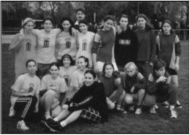
Így éreztük magunkat Szőnyben

szobáink és a nevelők irodái találhatóak. Három szoba lakóinak van egy közös fürdőszobája. Az épület két bejáratú. Az egyik felén a lányok szobái vannak, a másikon a fiúké.