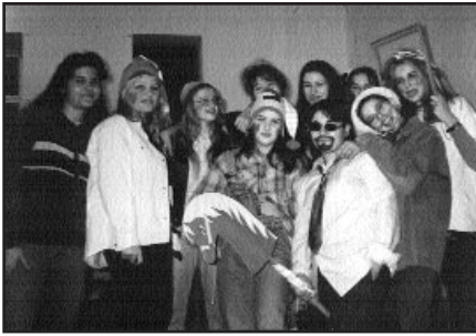
A „Hóizécske” című jelenet szereplői

Így van ez már 10 éve a kalocsai Hunyadi Kollégiumban, ahol a Mikulás nem csak ajándékot, hanem felejthetetlen élményt is hoz a puttonyába.