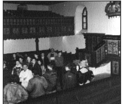
A szennai református templomban

Másnap reggel Szennára utaztunk a falumúzeumba, ahol egész utcát építettek fel a különböző vagyoni helyzetű parasz-