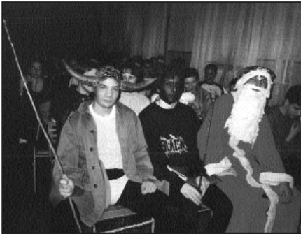
A Mikulás krampuszaival