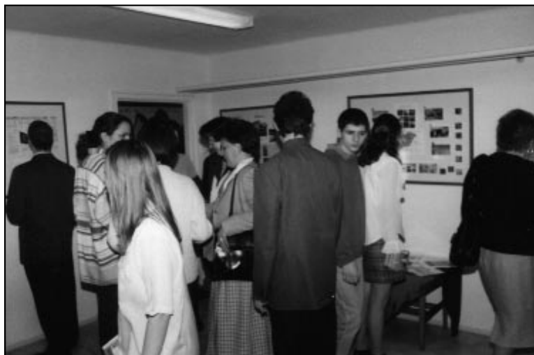
Kiállítás az Európai Unióról