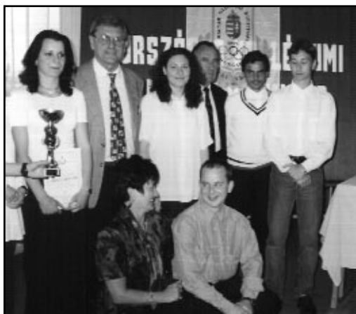
A zsűri és a győztes csapat

dezvénysorozata. A helyi kiállítások bemutatták a kollégiumok múltját,