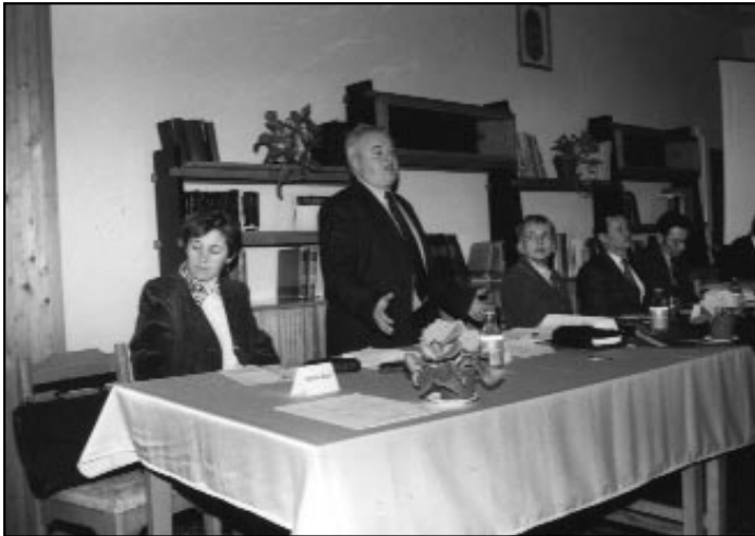
Az Európa-napi fórum előadói

Európa-napi rendezvénysorozattal „hozza közelebb” az 1999/2000. tanévben az Európai Uniót diákjaihoz a Szolnok Városi Kollégium. Az öt tagintézményben fórumokat rendeznek meghívott minisztériumi és helyi előadókkal, a közösség tagországait bemutató divattörténeti-, gasztronómiai- és környezetvédelmi délutánokat, EU-s szellemi vetélkedőket, kiállításokat szerveznek.