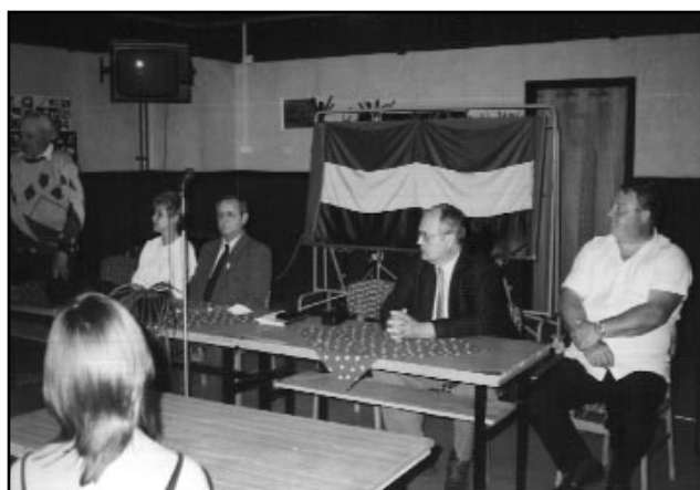
A meghívott öreg diákok és tanárok

a hangulatos tábortűz mellett történt. Ezen a napon, május 3-án 500 kollégium 70 ezer diákja hasonló