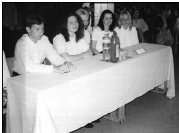
Az olimpiai vetélkedő győztes csapata a József Attila Kollégium