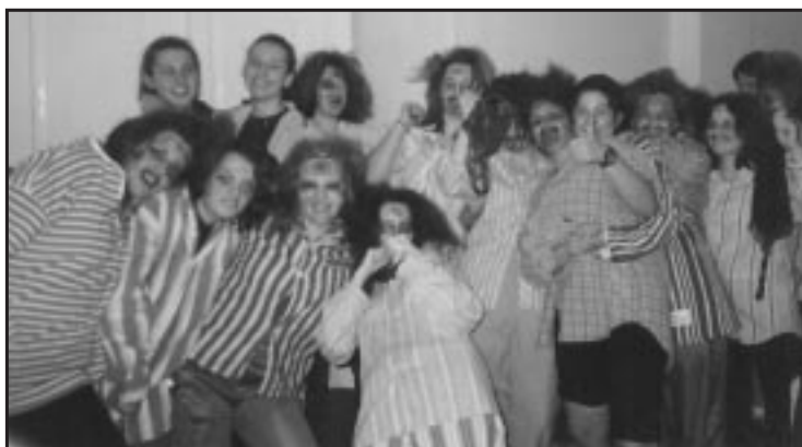
A börtön ablakába soha nem süt be a nap: - vagy mégis rájuk mosolyog?

Akinek még ez sem volt elég, azok szemetes lapáttal gyertyát fújtak, vagy éppen ruhafogasnak álcázták magukat. Az avató szöveg elhangzása után mindenki tanúsító okiratot kapott arról, hogy érdemes a Kollégium Polgára címre.