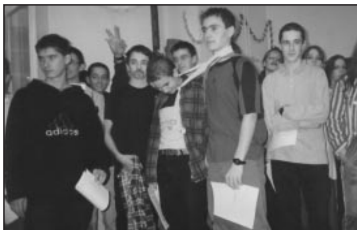
A tanúsító okirat birtokában