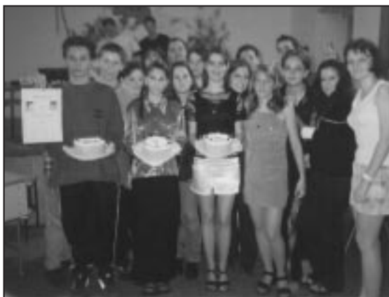
A vetélkedő győztesei

Idén sokkal több csapat, illetve első vett részt a vetélkedőn. Ezért a szervezésre nagy gondot fordítottunk.