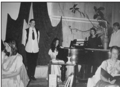
Ünnep a névadó tiszteletére