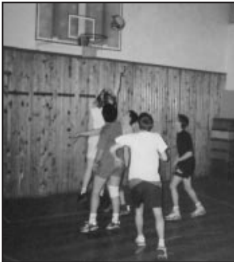
Kosarazás Karacs módra

Nálunk van a székhelye a Kollégiumi Diákszövetségnek, ami a vendégjárás miatt pezsgést hoz a mi életünkbe is, különösen a nyári táborokat szeretjük, ahol megismerkedhetünk más koleszosokkal, tapasztalatot cserélünk, felvilágosítjuk egymást.