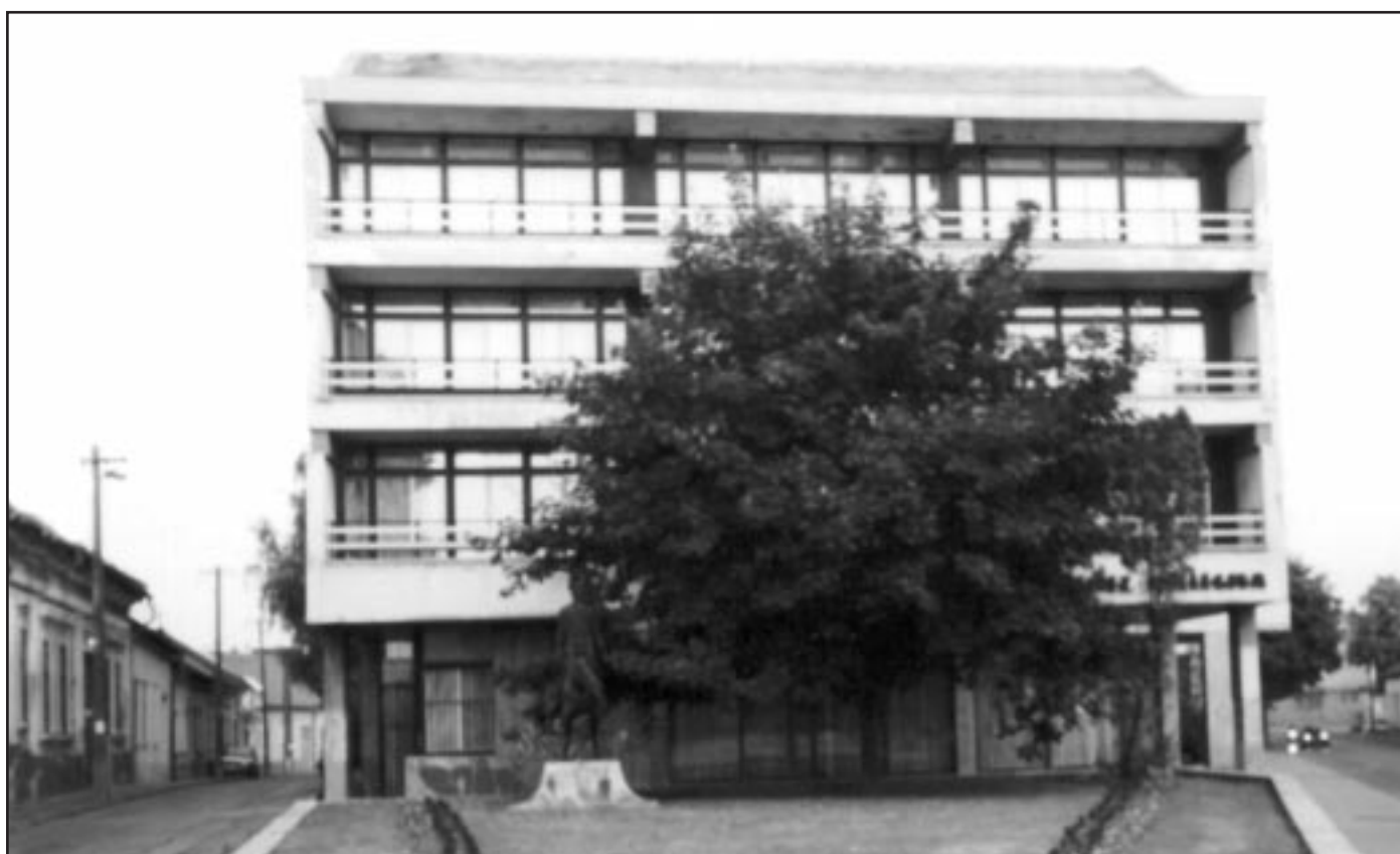
KARACS TERÉZ KOLLÉGIUM, VÁC