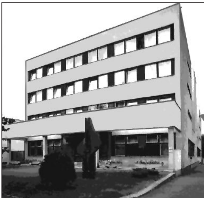
A kollégium épülete

9. évfolyamos tanulókkal, akiknek bemutatják a kollégiumot, megismertetik őket a kollégiumi élettel, a várossal. Délutánonként és esténként gazdag programok várják a leendő lakókat. Felkészülnek az elkövetkezendő tanévre, elkészítik a szoba-, tanuló-beosztásokat, az éves munkatervet.