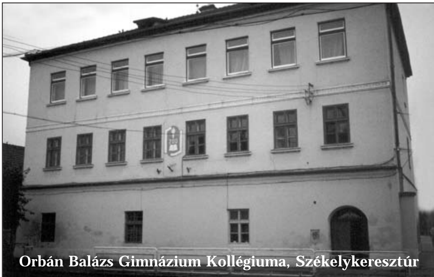
Orbán Balázs Gimnázium Kollégiuma, Székelykeresztúr