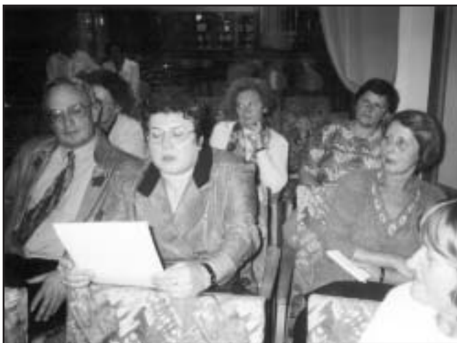
Néhány egykori tanítvány

A kalocsai kollégistáknak és az egykori tanítványoknak nagy élményt jelentett a „magával ragadó” előadásmód, az a hitelesség, amivel a Dsida versek hangulatát, a költő és kora lelki világát, érzelemgazdagsá-