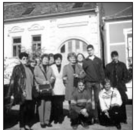
A kalocsai kollégium résztvevői