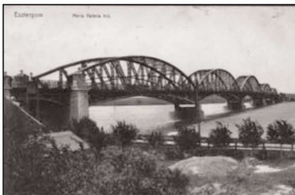
A régi Duna-híd (az 1944. évi felrobbantása előtt)