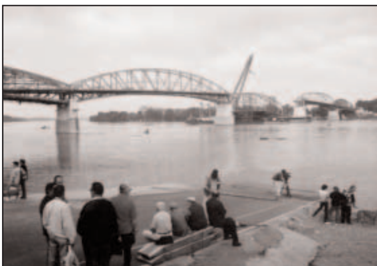
Az újjáépülő Duna-híd