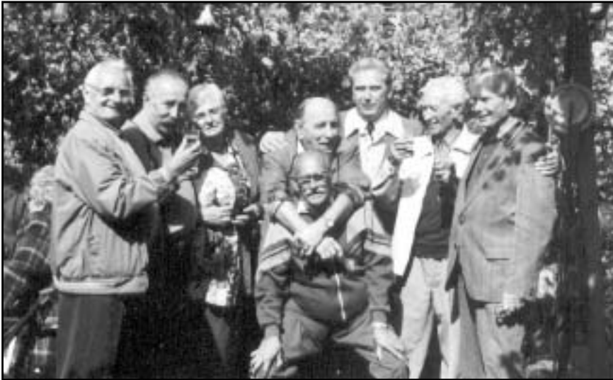
A Szabó Dezső Népi Kollégium tagjai az 1998-ban rendezett találkozó alkalmával.