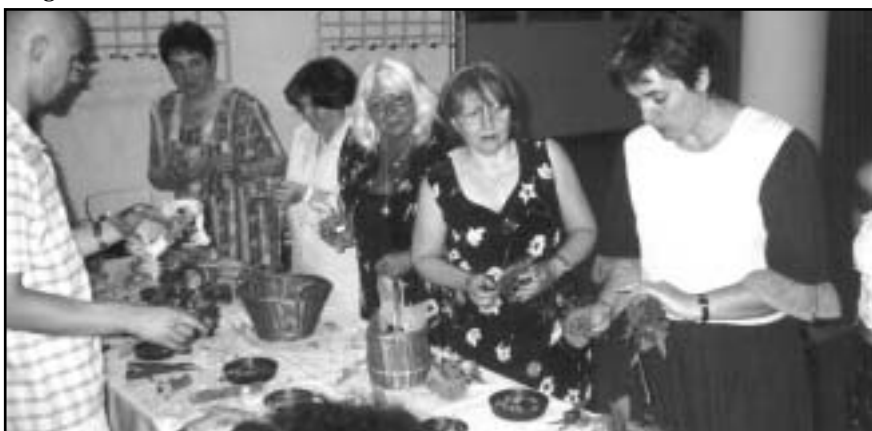
Játék és bábkészítés