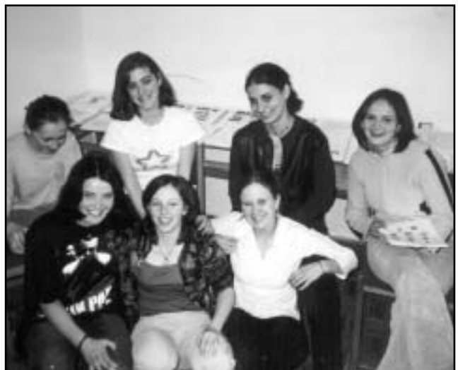
A kollégiumi újságjának szerkesztői