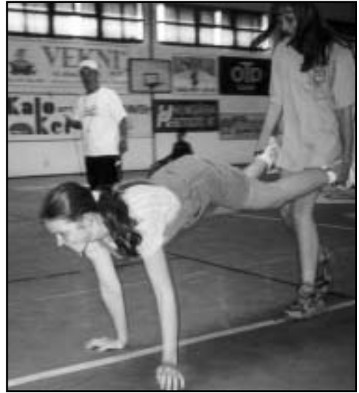
„Talicskázás“ a sportnapon