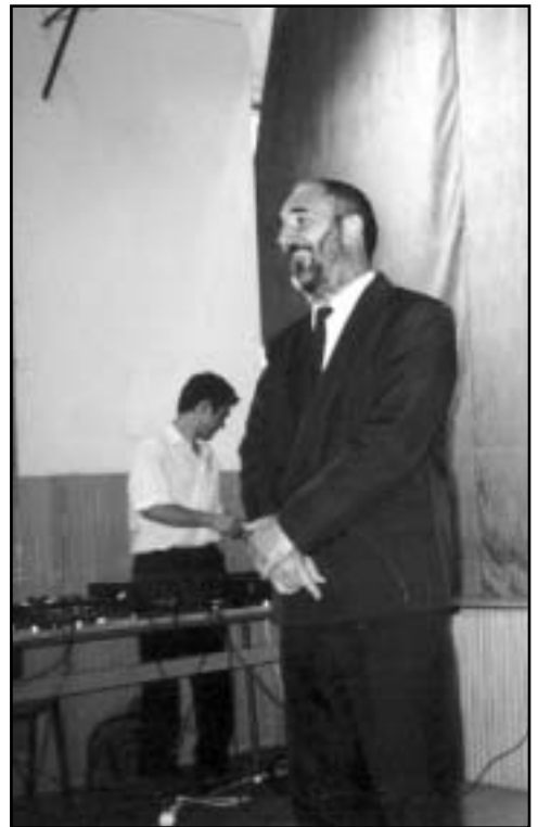
Sipos János helyettes államtitkár megnyitója

Kiemelkedően esztétikus alkotással szerepelt Diel Tibor, aki bőrből készített rózsákat és a szakmájának szépségeit érzékeltette cukrászati remekművével, mellyel első helyezést ért el. Zárásként, a nap fénypontjaként került bemutatásra a kollégium színjátszó körének előadásában Katona József: „Bánk bán” című darabja korhű jelmezekben. A Dózsa iskola dísztermét megtöltötték a szereplők szülei, az oktató iskolák tanárai, a Kalocsai Kollé-