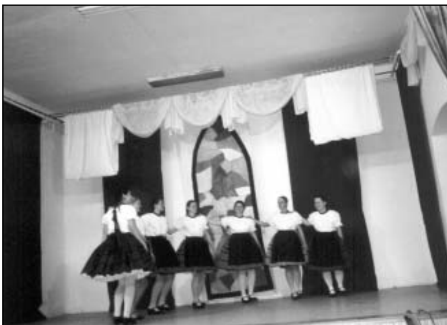
A kollégiumi néptánc csoport bemutatója