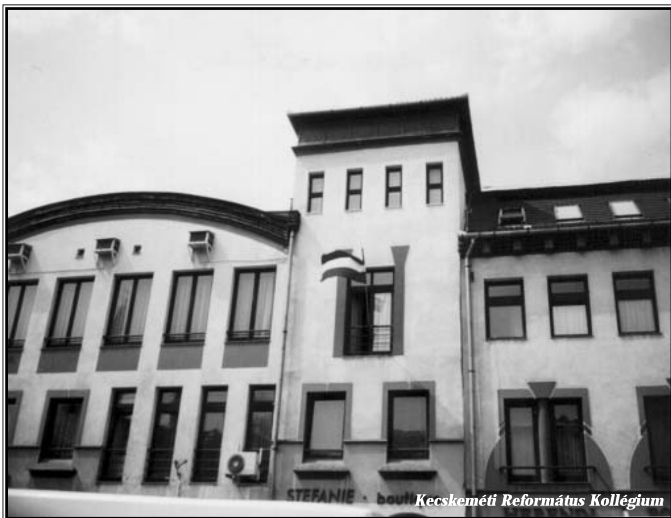
Kecskeméti Református Kollégium