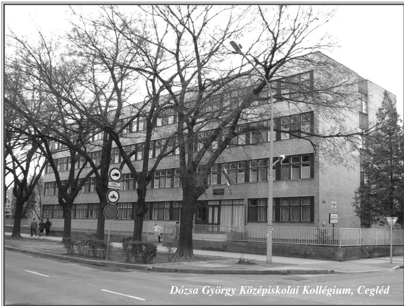
Dózsa György Középiskolai Kollégium, Cegléd