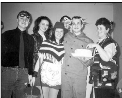
Piroska és a csillagfejű csavarhúzó

Hagyományainak megfelelően az idén is megrendezték a kalocsai Hunyadi-sok a jelmezversennyel és vidám produkciókkal egybekötött farsangi bált. A szervezés előkészítésében a diákönkormányzat ismét jeleskedett. A konyhafőnök asszony gondoskodott a tombola díjakról, melyért ezúton is köszö-