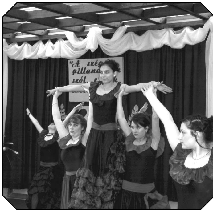
Spanyol tánc - előadják a kollégium tanulói

csapatot. Az egykori kollégisták ajándékkal köszönték meg a meghívást, sporteszközöket kaptunk ajándékba, amit minden volt kollégista dedikált is.