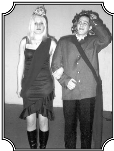
A bál „királyi párja“

kérték, ne legyen sötét, de még félhomály sem (a fejekben sem) a teremben. Hadd tudjanak egymás szemébe nézni a szerelmes párok (mert egy koedukált kollégiumban ez is előfordul). A szép-