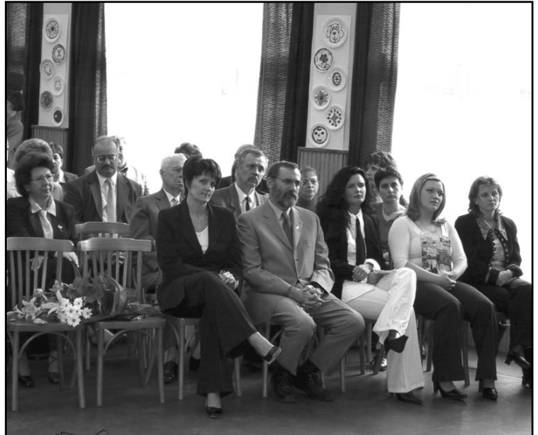
Az ünneplő közönség

Április 21-én a kollégium Diákönkormányzata Diáktalálkozót szervezett. 43 meghívott vendégből 33 volt kollégista fogadta el meghívásunkat. Megkoszorúztuk a Kossuth téren álló Dózsa-szobrot, majd játékos vetélkedővel, közös vacsorával, zenés műsorral ünnepeltünk. A játékos vetélkedő 5 csapatát úgy állítottuk össze, hogy minden csapathoz csatlakozhatott 2-2 volt kollégista is, így ők is ver-