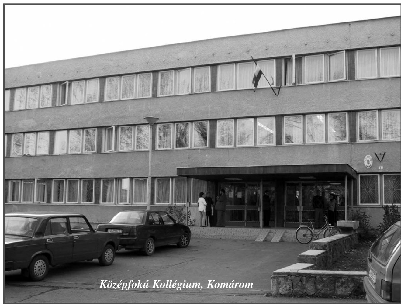
Középfokú Kollégium, Komárom