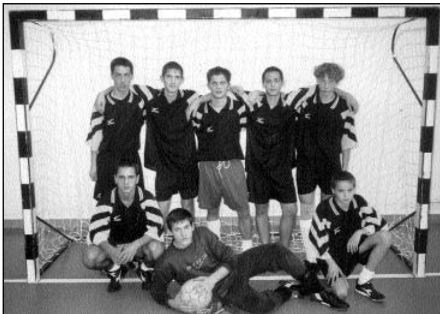
A kalocsai fiú labdarúgó csapat

a kiskunfélegyházi Mezőgazdasági és Élelmiszeripari Középiskola és Szakiskola Kollégiumában.