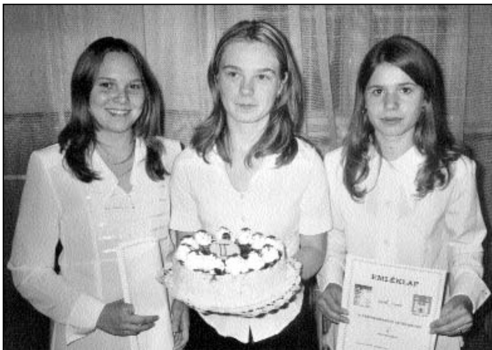
A városismereti vetélkedő II. helyezett csapata