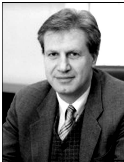
Országos Kollégiumi Konferencia 2005.