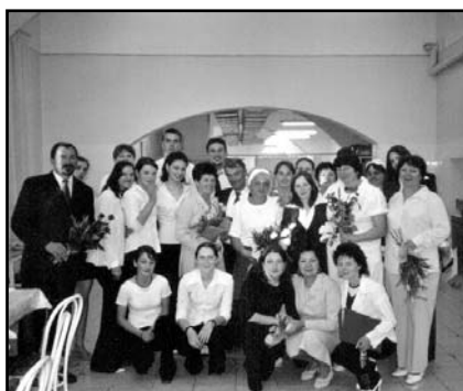
A konyha és a DÖK gondoskodott az ünnepi vacsoráról