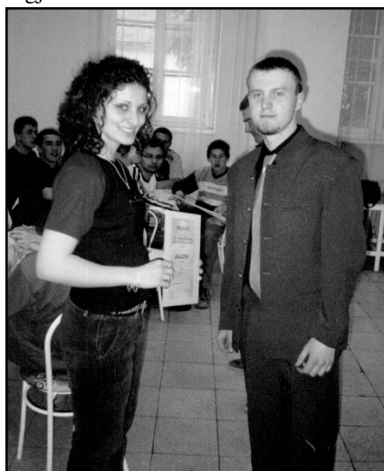
A diákigazgató oklevelet ad át a legjobb asztaliteniszözőnek

Fehérasztal mellett találkoztak a kollégium egykori dolgozói: - a Baráti Kör tagjai.