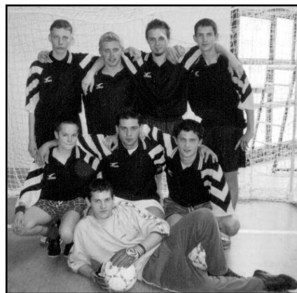
A sportnap főszereplői - a kollégium focicsapata

vács Ilona és Petróczy Ernőné tanárnők vettek részt.