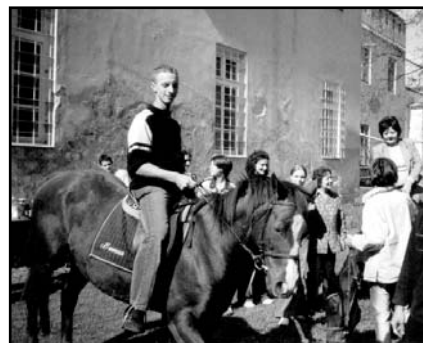
Lóra termett kollégisták