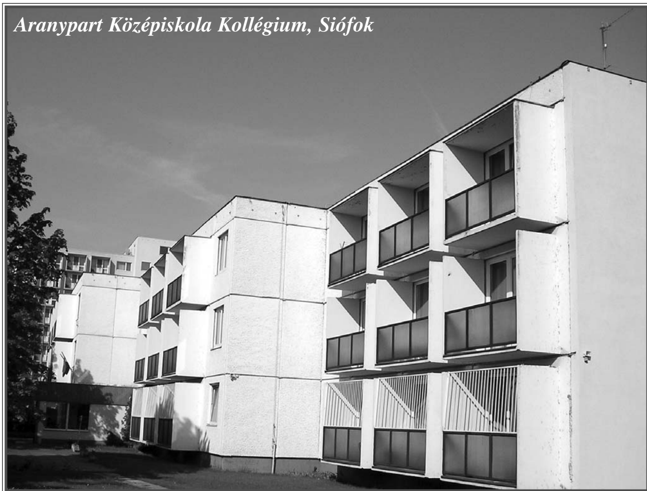
Aranypart Középiskola Kollégium, Siófok