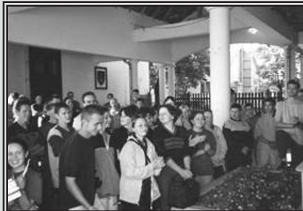
Bethlen Gábor Szakképző Iskola és Kollégium, Gyomaendrőd