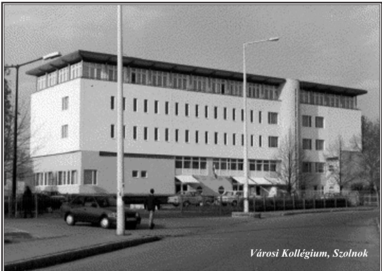
Városi Kollégium, Szolnok