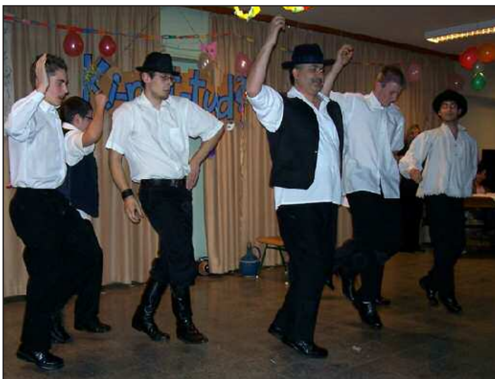
Verbunkost táncolnak a fiúk nevelőjükkel