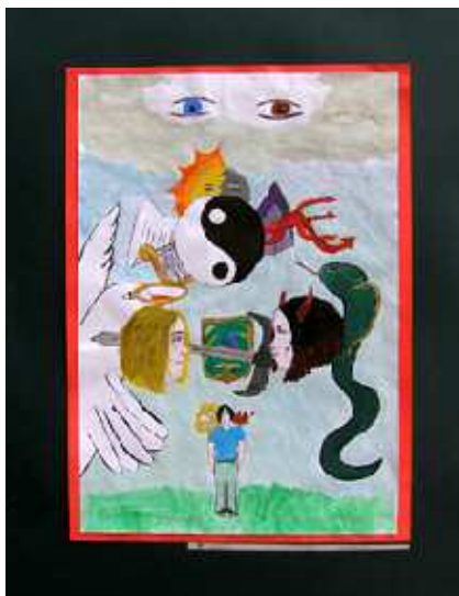
A jó és a rossz

Ez volt az Európa Tanács Információs és Dokumentációs Központjának képzőművészeti pályázati felhívása nemzetiségi gimnáziumi és szakközépiskolai diákok részére. Az Európa Tanács kiemelt feladatákként határozta meg az emberi jogok, ezen belül a gyermekjogok érvényesítését, megismertetését, védelmét a szervezet 47 tagállamában. A rajzpályázat célja az volt, hogy felhívja a figyelmet a gyermekek jogainak jelentőségére, mozgósítsa betartásukra és a gyermekeket érő erőszak minden formájának visszaszorítására az Európa Tanács „Építsük Európát a gyermekekért a gyermekekkel” programja keretében. A pilisvörösvári Friedrich Schiller Gimnázium kollégiumának diákjai lelkesen, örömmel vettek részt a pályázaton. Sajnos kevés idő jutott a pályamunkák elkészítésére (egy délután), de így is 10 kész művet továbbítottunk. A beküldött munkákat a neves művésztanárokból és az Európa Tanács Információs és Dokumentációs Központjának képviselőjéből álló zsűri értékelt. Szempontjaik közt szerepelt, hogy a mű