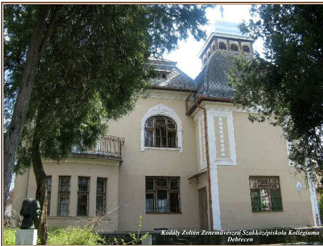
Kodály Zoltán Zeneművészeti Szakközépiskola Kollégiuma Debrecen