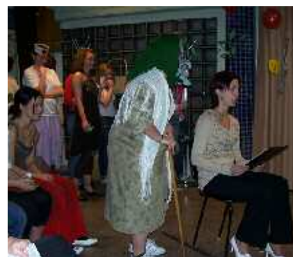
Csábítás meseországban szereplői

Bepillantottunk a mesevilágban előforduló csábítások folyamatába is, ahol Hófehérke és Csapkerózsika vetélkedett a Kisherceg kegyeiért – természetesen humoros megközelítésben.