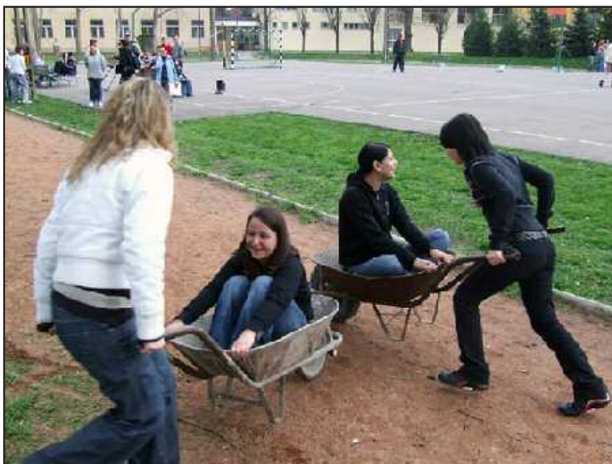
Az Arany-hét egy érdekes pillanata

Kollégiumunkban (a sarkadi Ady-Bay Középiskola Arany János Kollégiumában) 2008. március 31.-április 3. között került sor a hagyományosan tavasszal megrendezendő „Arany-hétre”.