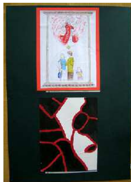
Ne fordítsd meg