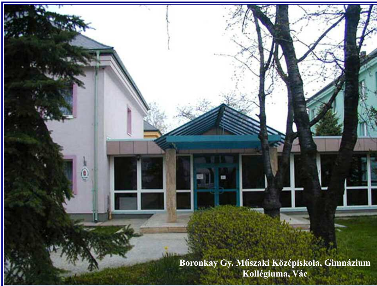
Boronkay Gy. Műszaki Középiskola, Gimnázium Kollégiuma, Vác