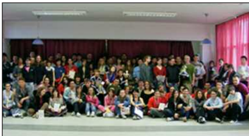
Záró-kép a résztvevőkkel, eredményhirdetés után

Az étkezést a kollégium diákjainak étkezését adó Penzió 17 Kft biztosította. A reggeli svédasztalos rendszerben került kialakításra, az ebéd és vacsora tálcásönkiszolgáló rendszerben. A rendezvény ideje alatt a kollégisták