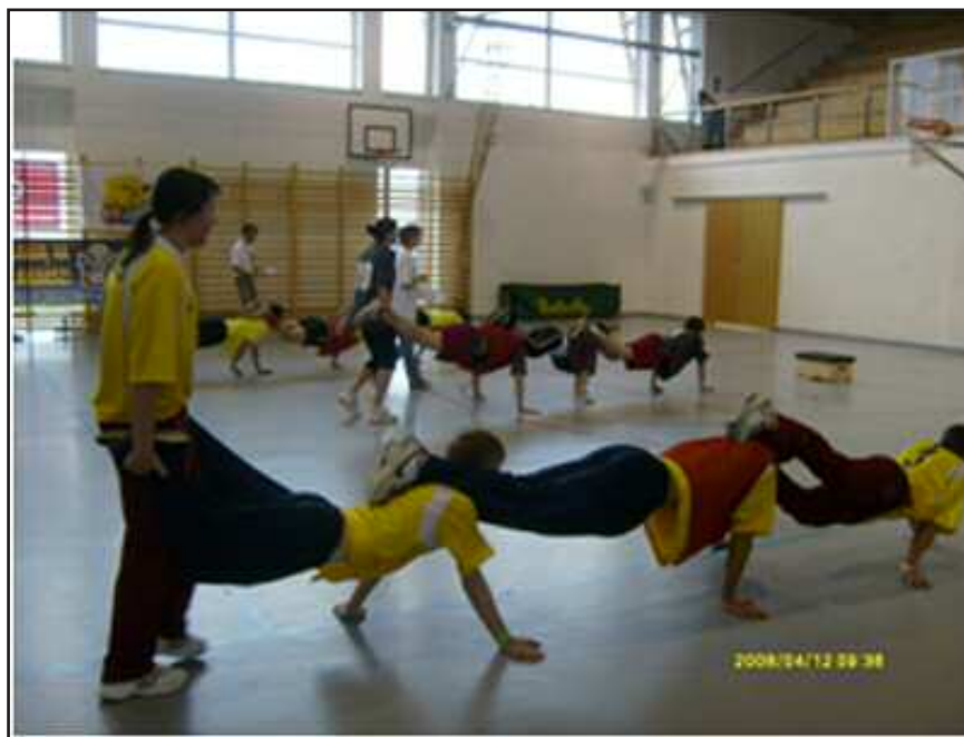
Együtt marad, vagy szétesik a talicska?

A sportversenyek köréből az egyik legnépszerűbb sportversenyszám a kötélhúzás volt, ahol a csapatok hatalmas küzdeni tudásról tettek tanúbizonyságot. A meglepetés versenyszám vízi-váltója pedig ismételten nagy versengést eredményezett. Az egyéni versenyszámok sporttel-