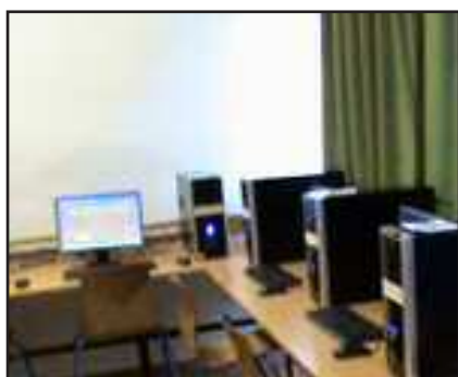
Az új gépek

A lányok számára az első emeleten lévő számítástechnikai termünk régi, hat éves gépein megdupláztuk a RAM-t (512-re), ezek a gépek máso-