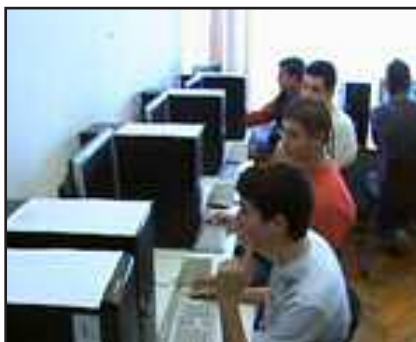
Teljes a kihasználtság

Az V. emeleten lévő számítástechnika termünkben cseréltük le a 9 éves gépeinket és a 11 éves szerverünket, 22 db modern, nagyteljesítményű gépre. A város iskoláiban használatos szoftvereket telepítettünk Windows XP operációs rendszer alá.