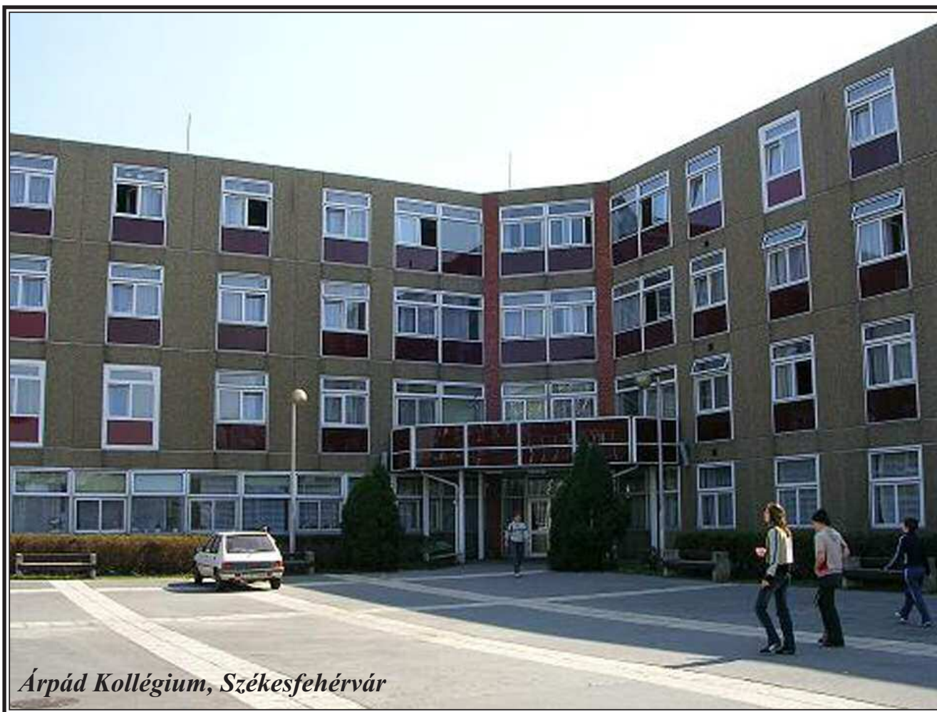
Árpád Kollégium, Székesfehérvár