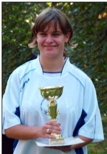
A győztes mosolya

san kimérve felfestették a váltás helyét, a vetélkedés napján pedig kihelyezték a figyelmeztető és az állomásjelző táblákat; valamint felkeresték a Polgárőrséget és a Rendőrséget - ezúttal szeretnénk megköszönni pótolhatatlan segítségüket - , akik a kereszteződések lezárásában, a forgalmasabb helyek biztosításában és a felvezetésben vettek részt. Az idősebb és megbízható diákok, valamint a tanárkollégák segítségére is szükség volt: a váltóhelyeken minden évben ők felügyelik a rendet, irányítják az