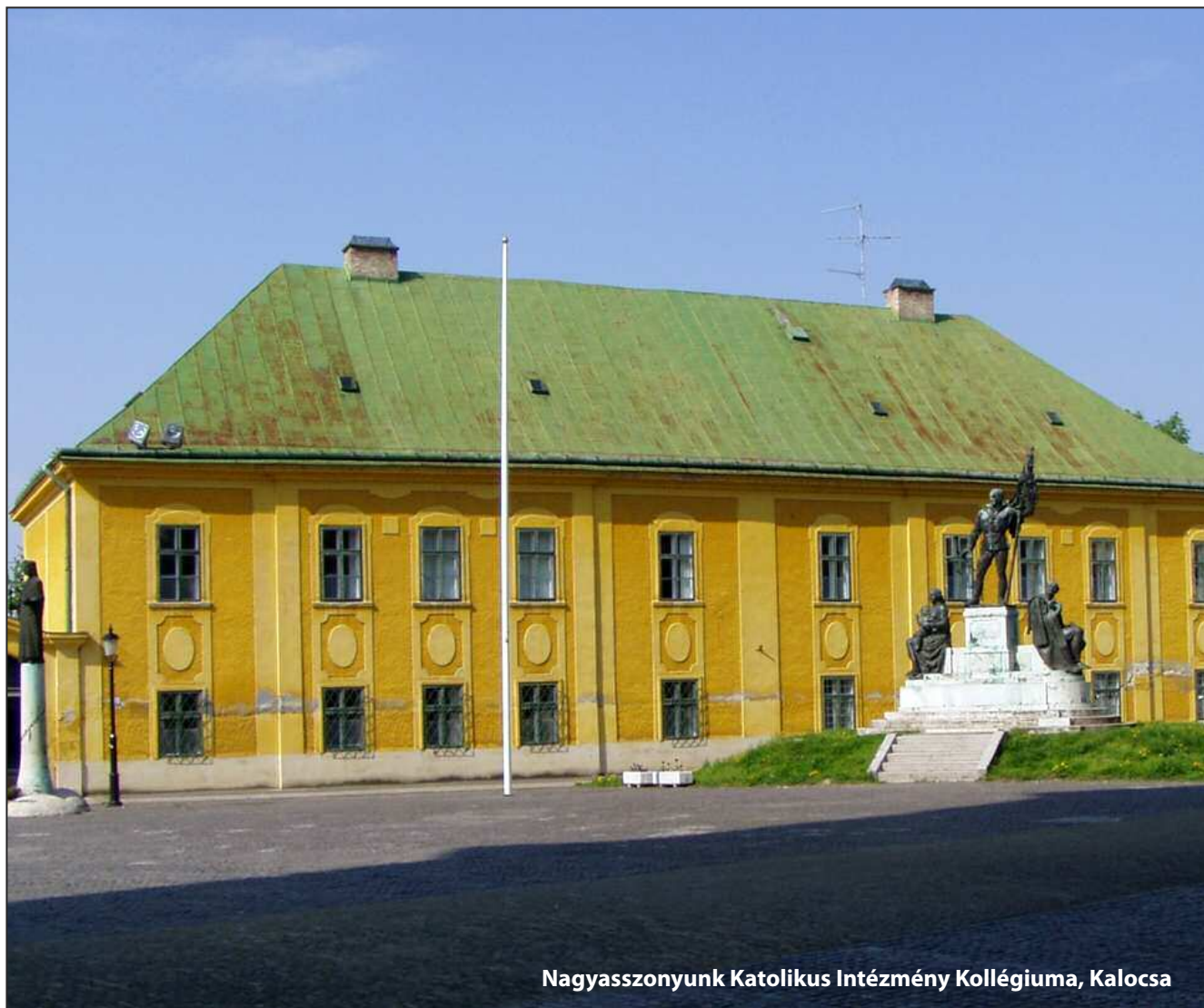
Nagyasszonyunk Katolikus Intézmény Kollégiuma, Kalocsa