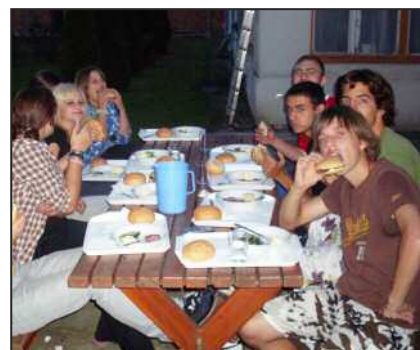
Vacsora az udvaron

Igyekszünk a diákoknak a kultúra különböző területeit bemutatni, ezért minden hónapban a tanulók igénye szerinti rendezvényen veszünk részt, ebben a tanévben a Szegedi Kulturális Fesztivál