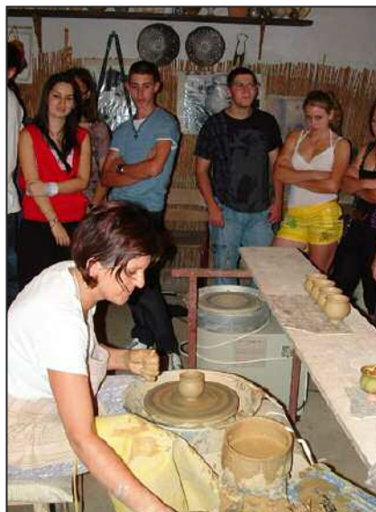
A Fazekas Alkotóház megtekintése

harmincöten költöztek új fészükbe, valamivel több lány, mint fiú. Így jelenleg 51 fiú és 52 lány lakója van az intézménynek. Az intézményvezető azt is elmondta, hogy részben, mert a kollégium már koedukált, részben mert a nevelési szemlélet is a kor igényének megfelelően rugalmasabb a korábbiaknál. Ma már nem okoznak gondot a szökések, éjszakai „dobizások”, mint 30-40 évvel ezelőtt. A kollégium pedagógiai módszertani kultúrájában nem a tiltások, a