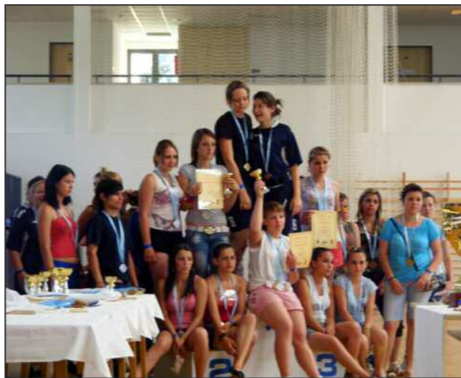
Sikeres volt az Arany János Programot megvalósító kollégiumok diákjainak szervezett III. olimpia.

Kiskunfélegyházán a Kiskunfélegyházi Szakképző Intézmény Kossuth Lajos Középiskolájának Kollégiuma szervezésében 2011. június 3-5-ig bonyolították le a Halmozottan Hátrányos Helyzetű Tanulók Arany János Kollégiumi – Szakiskolai Programjában, az Arany János Tehetséggondozó és az Arany János Kollégiumi Programjában részt vevő tanulók számára kiírt sportversenyeket.