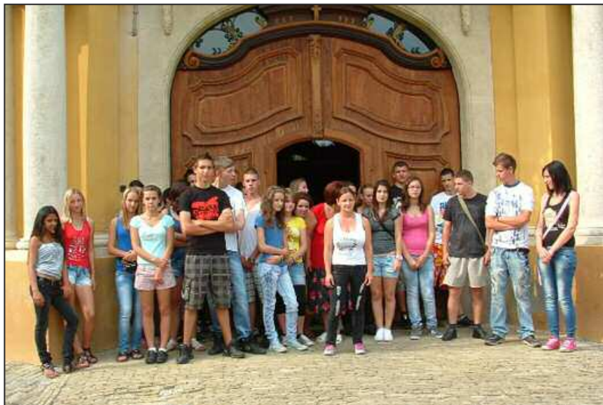
Látogatás az érseki kastélyban