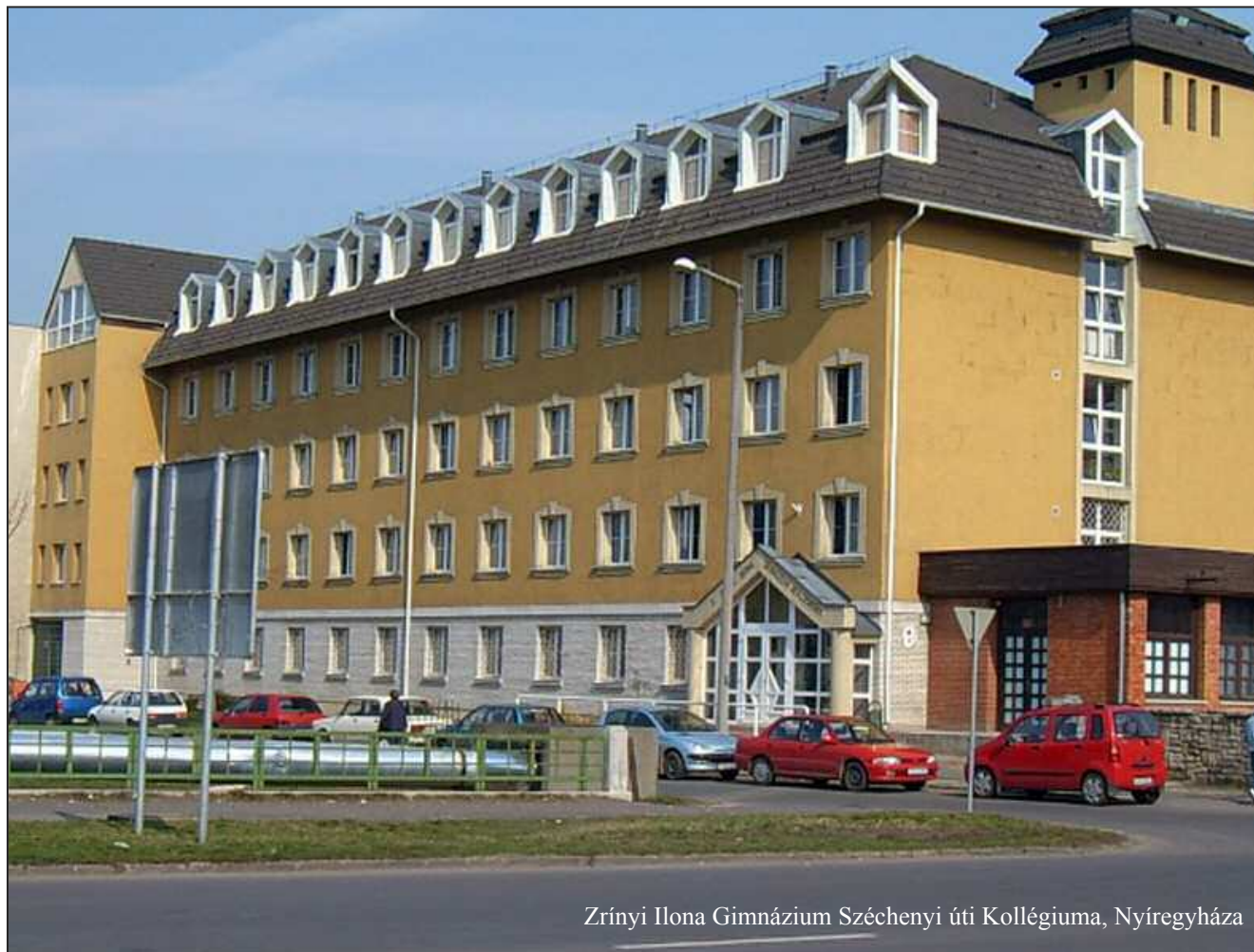
Zrínyi Ilona Gimnázium Széchenyi úti Kollégiuma, Nyíregyháza