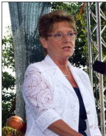
Dr. Hoffmann Rózsa oktatásért felelős államtitkár