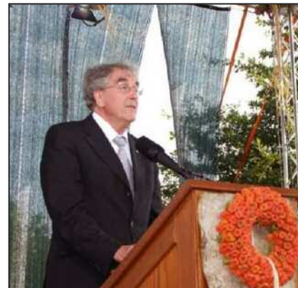
Dr. Réthelyi Miklós miniszter

Az államtitkár asszony szomorúan jegyezte meg, hogy az iskolák identitásképző ereje meggyengült. Mindezek miatt is szükség van az új nemzeti alaptantervre. Hoffmann Rózsa elmondta, hogy megerősítik az állam finanszírozó, működtető és ellenőrző szerepét s ezzel együtt megerősítik a tanárok megbecsülését.